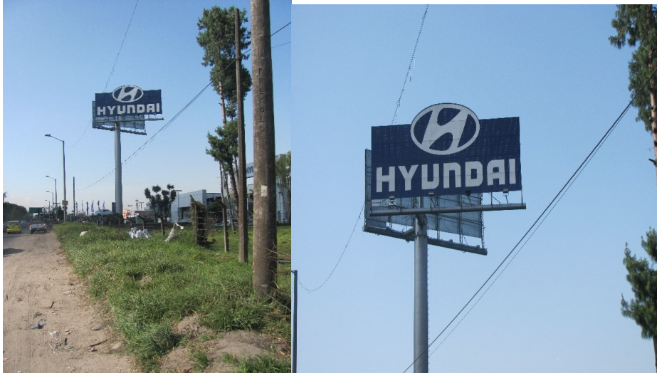
VISTA PANORÁMICA DEL ELEMENTO DE PUBLICIDAD EXTERIOR VISUAL TIPO VALLA TUBULAR COMERCIAL INSTALADO – SENTIDO NORTE - SUR: LOGO + HYUNDAI